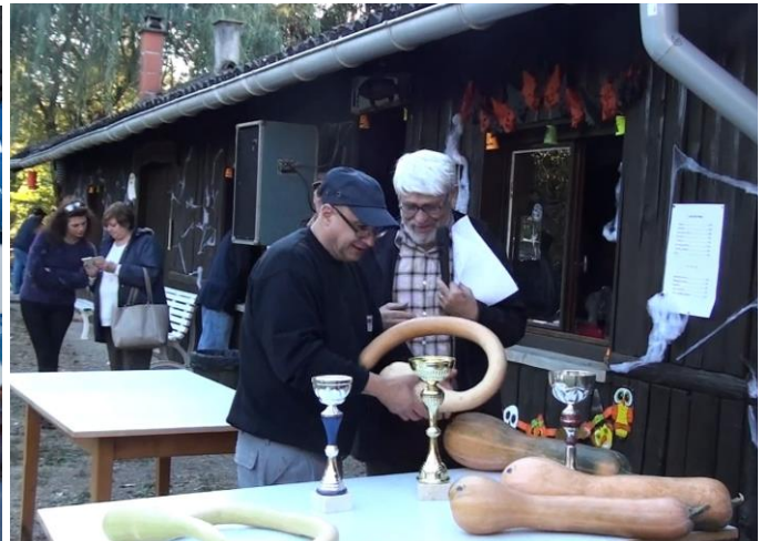
1 er prix : truite saumonée de 3,550 kgs