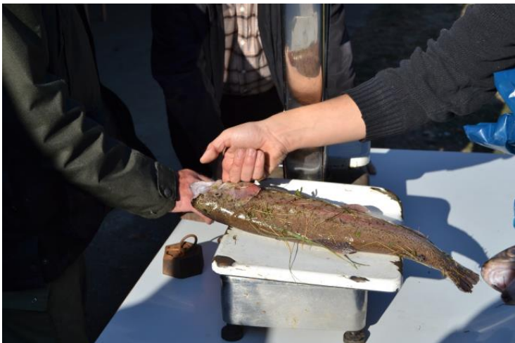
De belles prises