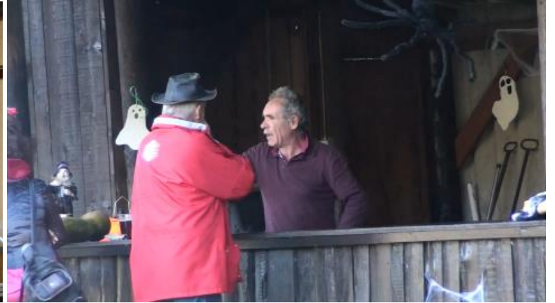
Les stands sont prêts