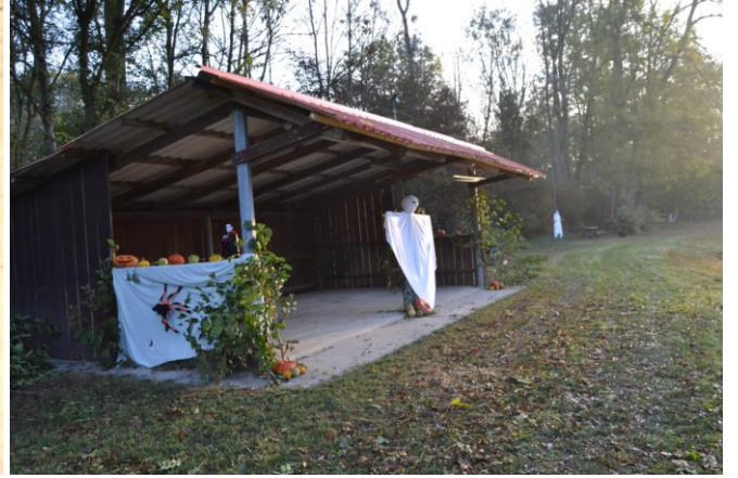
Formidables décorations !