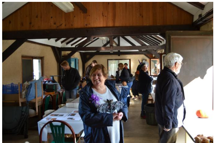
La réception "clients" est parée