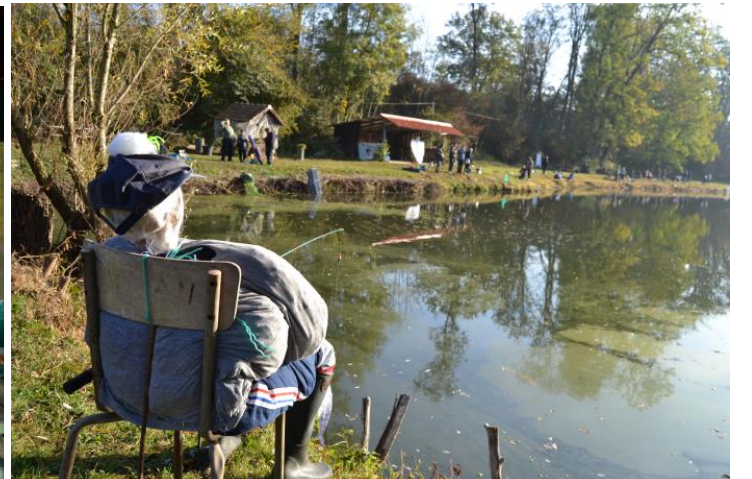
La mascotte du jour baptisée "Jean-Claude"