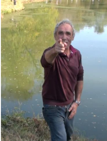
J' t'ai vu !