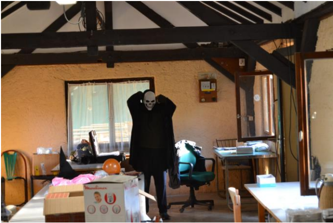
Inconnu ? Peut-être pas...