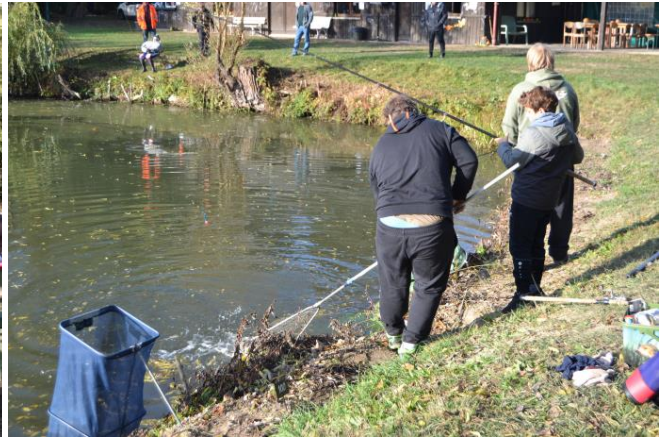
Un coin à réussite