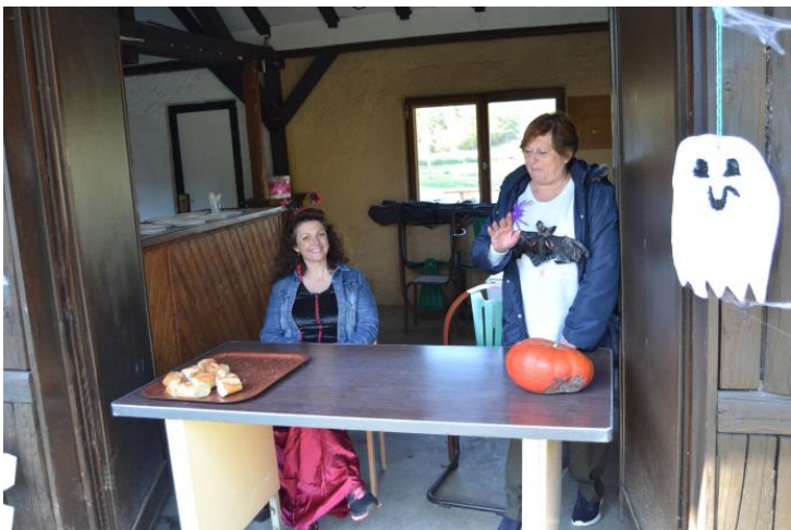
Toujours accueil clients