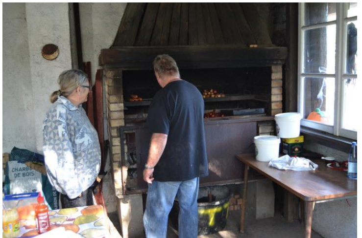
La zone grillades, ça chauffe