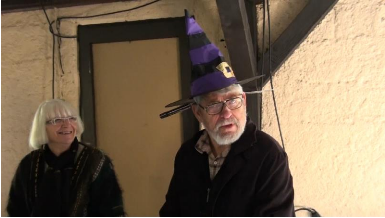
Le président donne l'exemple ...