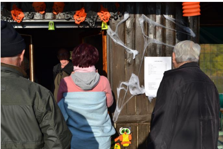
Le point "caisse" bien sollicité