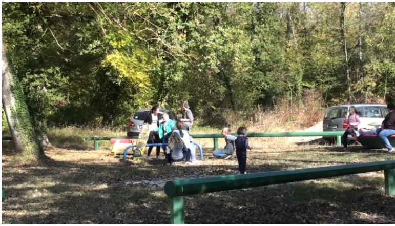
Le parc "jeux" pour les plus petits, bien fréquenté